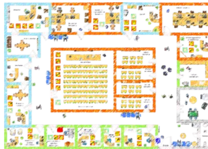
Plateau Organisme de formation

Tous les services de l'entreprise/organisme seront impliqués dans la Démarche Qualité